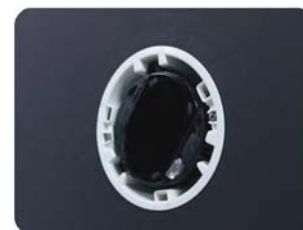
E-BEAM30 installato ad incasso