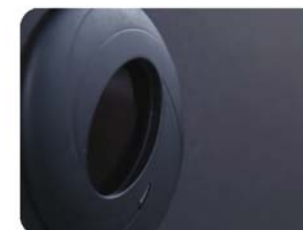
Risultato finale: Massima discrezione