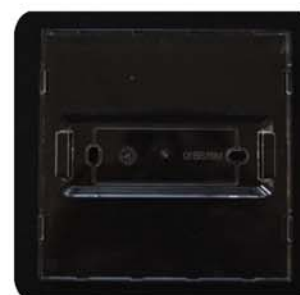
Supporto trasparente per il catarifrangente

Il catarifrangente si fissa al muro tramite un supporto trasparente e ha delle proprietà ottiche tali che gli permettono di assumere la stessa tonalità del colore della parete sulla quale è fissato.