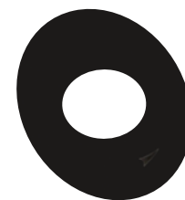
Frontale in tinta con la parete